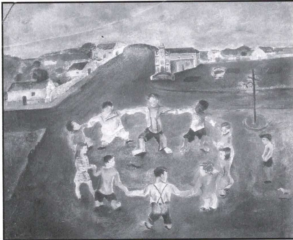
Ronda Infantil - Candido Portinari - 1932 - óleo sobre tela